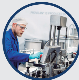
Validierte Formel mit pB, die für verschiedene Zwecke gemischt werden kann.