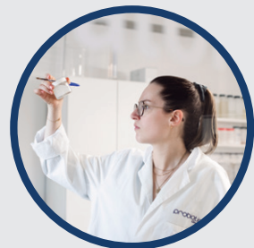
Auswahl der Stämme auf der Grundlage von Sicherheit, Pathogenität, Wirksamkeit und Stabilität