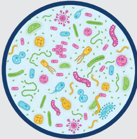
Probennahme probiotischer Bakterien aus verschiedenen Quellen

Von der Natur zu topischen Probiotika, die gebrauchsfertig, wirksam, nachhaltig und ökologisch sind.