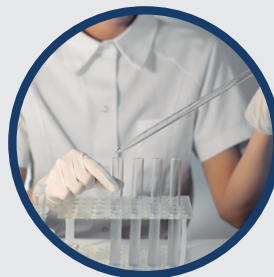
Mischung von probiotischen Bakterien (pB) als Cocktail aus verschiedenen Stämmen