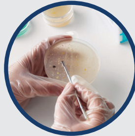
Isolierung der Stämme