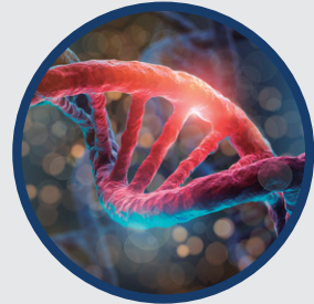
Identifizierung der Stämme durch Genomanalyse